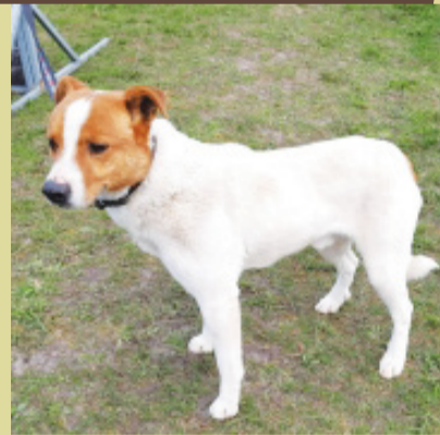
Pies rasy mieszanej, średniej wielkości. Umaszczenie biało-brązowe. Wiek około trzech lat.