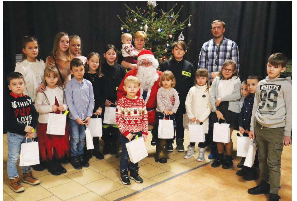
fol. P. Markowski