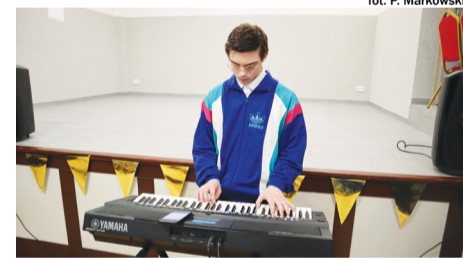
fol. P. Markowski

Została ona podzielona na kilka części. W pierwszej zaprezentowali się uczniowie placówki, pokazując swoje talenty. Widzowie, którzy wypełnili salę po brzegi, mogli podziwiać układy taneczne, prezentacje wokalistek i grającego na keyboardzie instrumentalisty. Były też pokazy mody. Najpierw wystąpiły przedszkolaki w strojach prezentujących postaci z bajek, ale też wskazujących na ich wymarzone zawody. Starsi uczniowie pokazali się w strojach