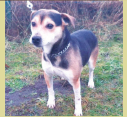
Pies rasy mieszanej. Wiek około 3 lat. Umaszczenie tricolor.