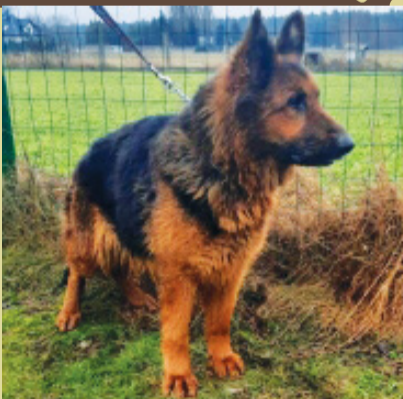
Suczka w typie rasy owczarek niemiecki. Wiek około 6. lat. Umaszczenie czarna-podpalana.