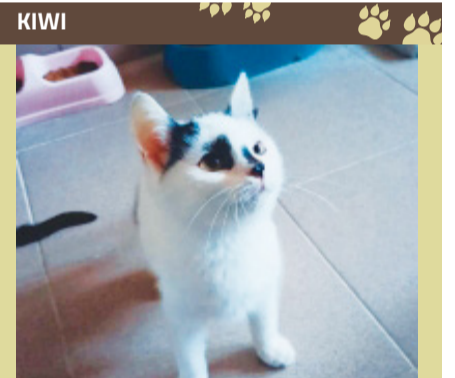
KOTKI Kot domowy, mały. Umaszczenie białe w czarne łaty. Zaszczepiony, odrobaczony. Wiek około 6. miesięcy. Do adopcji w schronisku w Koninie.

Zdjęcia psów przeznaczonych do adopcji są opublikowane na stronie www.krzymow.pl w zakładce „Dla mieszkańców”, w rozdziale „Zwierzęta do adopcji”. Po informacji na temat psów do adopcji można również zgłaszać się do Urzędu Gminy w Krzymowie, pokój numer cztery. | mar.