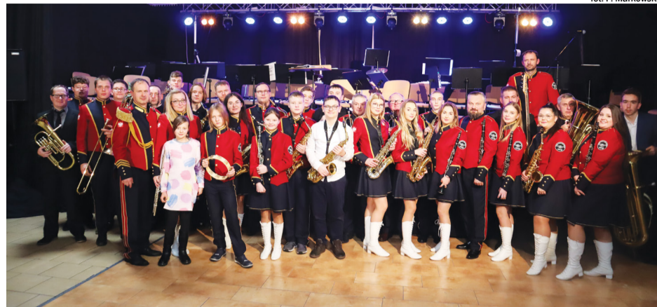
fol. P. Markowski