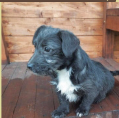
Pies rasy mieszanej. Umaszczenie czarno-białe. Wiek, około pięciu miesięcy.